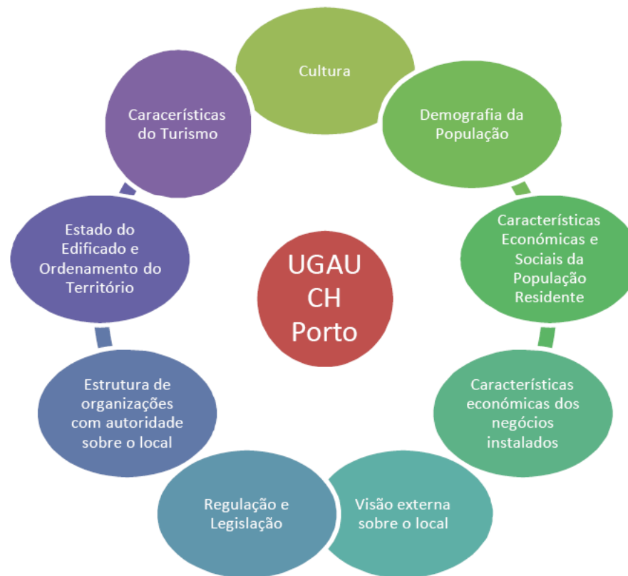
Figura 1 - Envolvevente contextual

Tendências, gostos, normas e formas de estar que condicionam a actividade da UGAU CHP, sem que esta os consiga influenciar de forma directa.